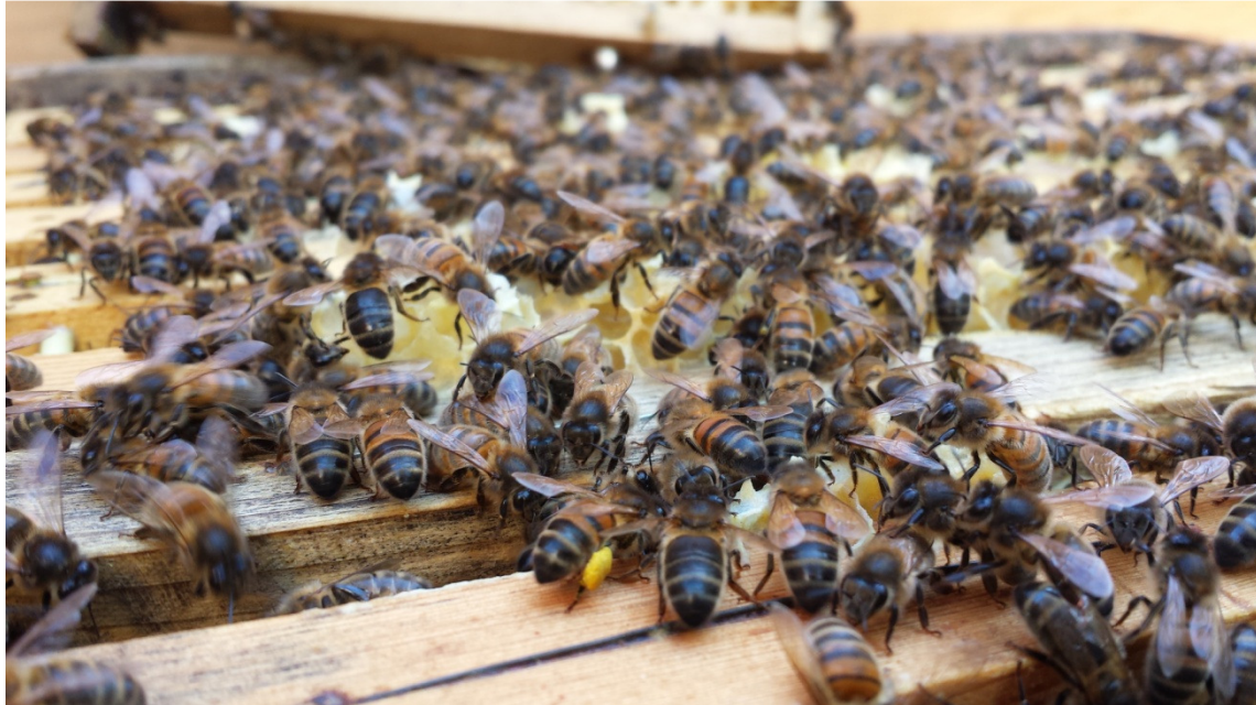
Full fart i kuporna!